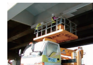
3 トップコート塗布