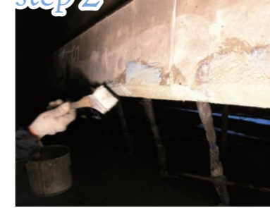
下地処理 (断面修復)