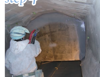
超速硬化ウレタン吹付け