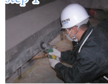
下地処理 (サンディング)