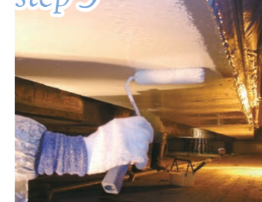
トップコート塗布