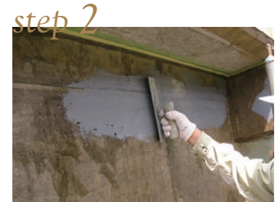
1成分形ウレタン塗布 (1~2回)